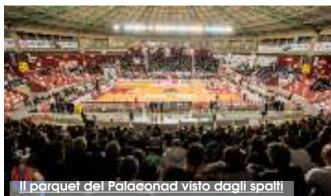
Il parquet del Palaconad visto dagli spalti